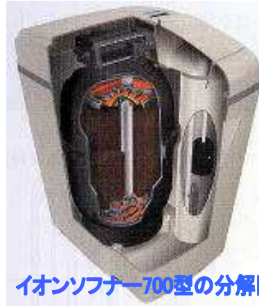
イオンソフナー700型の分解図