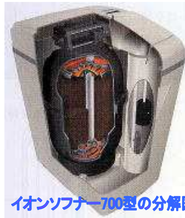
イオンソフナー700型の分解図